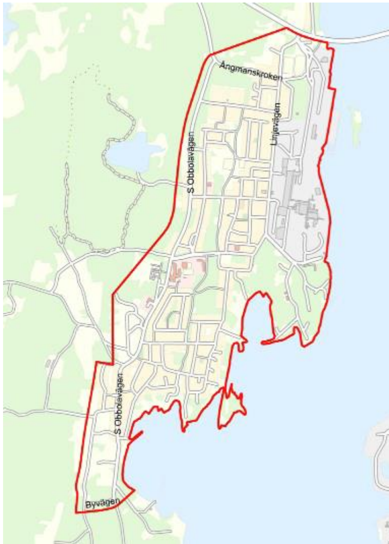
Figur 1. Område för ny datumparkering, Obbola.

datumparkeringsförbudsområdet över hela kommunen. Detta kan även komma att påverka huruvida nya framtida parkeringsförbudsområden kommer att införas inom Umeå kommun.